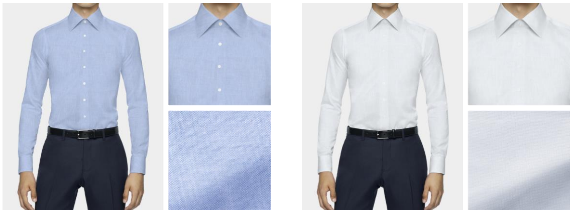
シャツオーダーイメージ