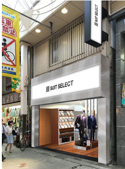
SUIT SELECT_ASAGAYA イメージ