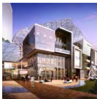
ウェストゲートショッピングセンター イメージ

ジュロン イースト地区に新規開業予定の同ショッピングセンターは、地下2階から地上5階までの床面積が39600平方メートルという大規模な商業施設で、百貨店をはじめ様々な海外発の人気ブランドや、数多くの飲食店、電化製品、家庭用製品、スーパーマーケットなどが開店を予定しており、ライフスタイルモールとして期待されています。