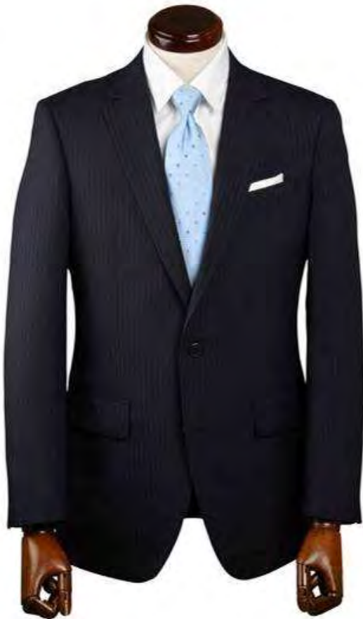
COLD SUIT FABRIC