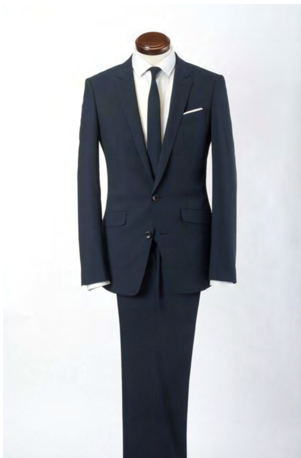
『SUPER TOUGH 100's』SKINNY SUIT

『SUPER TOUGH 100's』は、ハードにスーツを着用するビジネスシーンはもちろん、就活、自転車通勤等にも最適なタフなスーツです。