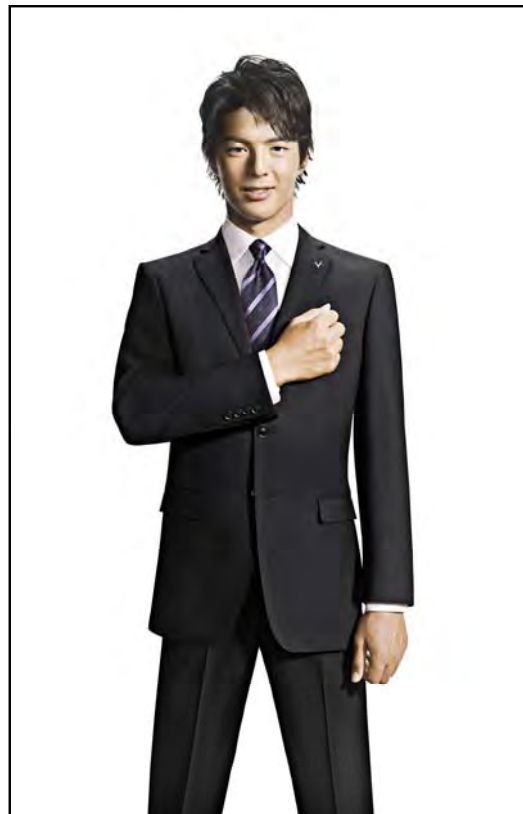
就活 V スーツ(着用:イメージキャラクター 石川遼プロ)

“就職活動に勝利するスーツ”をテーマに開発し、就活成功のポイントである第一印象の向上をサポートし、また「就活Vスーツ」のラベル部分には、就活生の皆さんの勝利を祈って「Victory (= 勝利)」の“V”の字をかたどったバッジを装着しています。