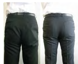
一般的なスーツ X-SUIT KONAKA