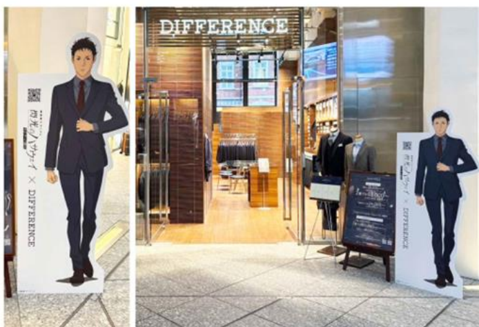
DIFFERENCE KITTE 丸の内店

この度、13店舗限定で物語を象徴する3人のキャラクター「ハサウェイ・ノア」「ケネス・スレッジ」「ギギ・アンダルシア」が、等身大パネルとなって皆さまをお迎えいたします。劇中で彼らが纏う洗練されたスタイルや、圧倒的な存在感をぜひ間近でご体感ください。