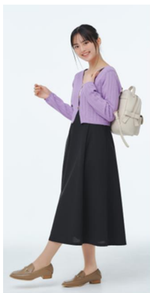
上品シンプル派 通学スタイル