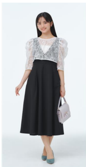
お出かけスタイル