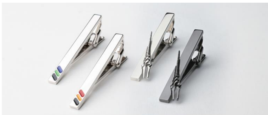
① 「イメージカラー」タイバー ② 「ロンギヌスの槍」タイバー