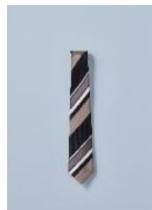
TIE ¥5,500(税込) BLACK LINE 大剣 7.5cm幅