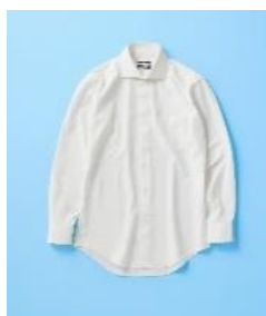
SHIRT ¥4,290 (税込) ワイドカラー