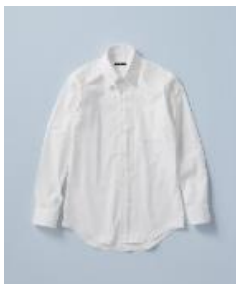
SHIRT ¥4,290 (税込) タブカラー