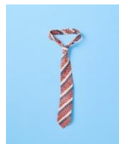
TIE ¥5,500(税込) BLACK LINE 大剣 7.5 cm幅