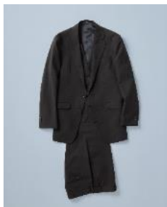
SUIT ¥42,900(税込) 櫻井海音着用スーツ