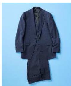
SUIT ¥42,900(税込) 櫻井海音着用スーツ