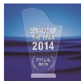
2014年 アパレル部門賞