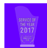
2017年 ハイレベル接客スキル大賞