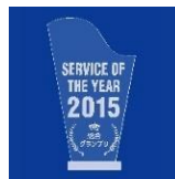
2015年 総合グランプリ