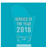
2018年 ホスピタリティ大賞