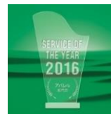
2016年 アパレル部門賞