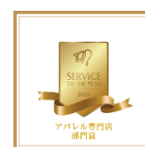
2021年 アパレル専門店部門賞