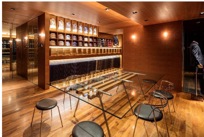
ディファレンス青山店

専用アプリをダウンロードすることにより、注文～受け取り、その後の相談まで全てのプロセスをお好きな時にご自身の操作で完結でき、最速2週間で高品質なオーダースーツを受け取ることができる、デジタルとリアルが融合した革新的なサービスを提供しています。