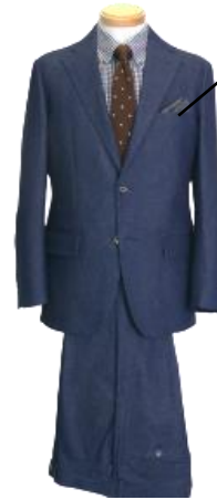
① デニムセットアップ