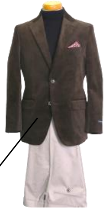
② コーデュロイセットアップ