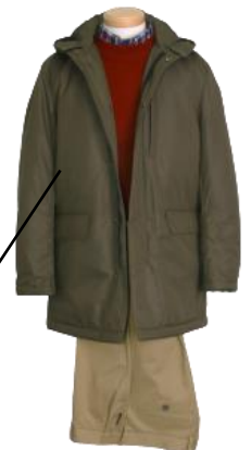
⑥ フーデッドコート