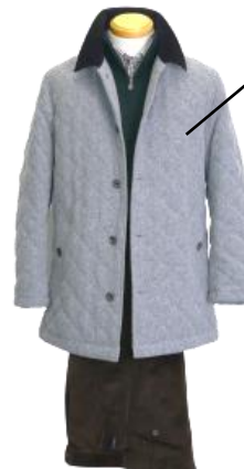
⑥ キルティングコート