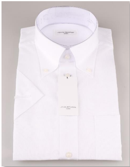
従来のプラスチック付属仕上げ