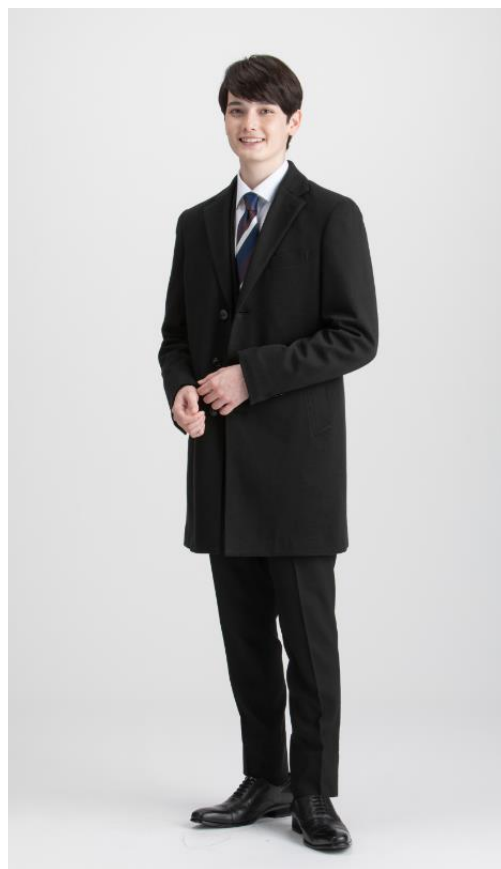
ULTRA MOVEチェスターコート