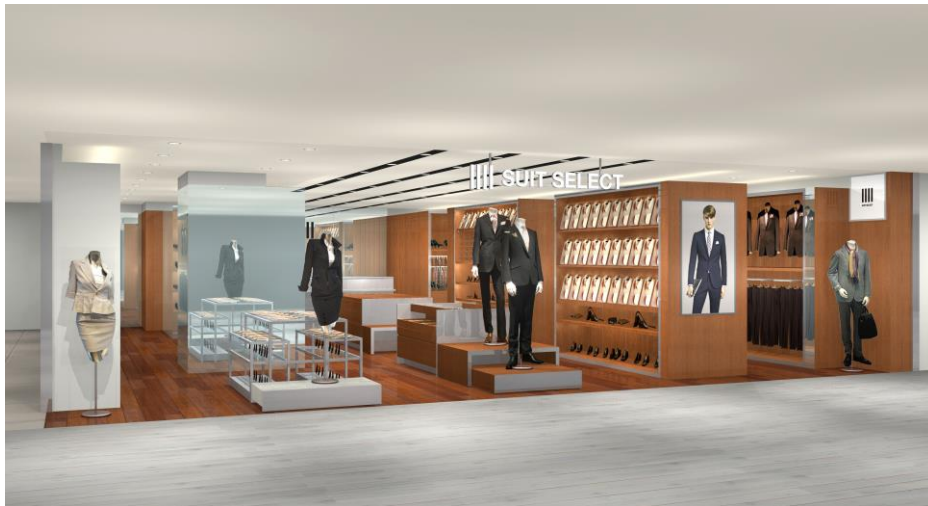
SUIT SELECT_TAKASAKI MONTRES イメージ