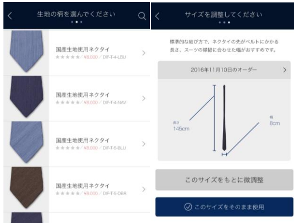
ネクタイ オーダーイメージ