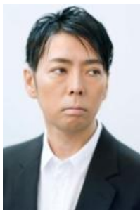
佐藤可士和 クリエイティブディレクター

トータルプロデューサーにクリエイティブディレクターの佐藤可士和氏を迎え、商品・サービスの開発やフラッグシップショップのデザインを担当。さらに、WOMEN'S(女性向け)のサービスでは、数々の主要女性誌を中心に活躍中の実力派スタイリスト、徳原文子氏をディレクターとして起用、定評ある的確でセンスの光る彼女の提案力を活かし、シーンもバリエーションも限られていた女性向けオーダースーツの新たなニーズにも応えていきます。スマホアプリやブランドWEBの設計・ディレクションには、これまで様々な話題作を開発・発表してきたインターフェースデザイナーの中村勇吾氏(tha)を起用。採寸からアプリ体験、納品まで一気通貫したハイクオリティなサービスをお届けしてまいります。