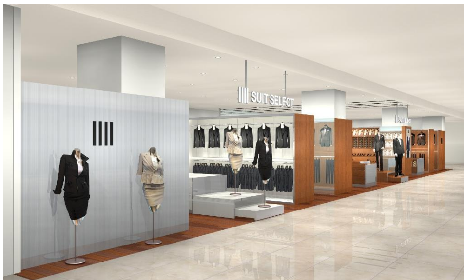
SUIT SELECT_FAIRMALL FUKUI イメージ